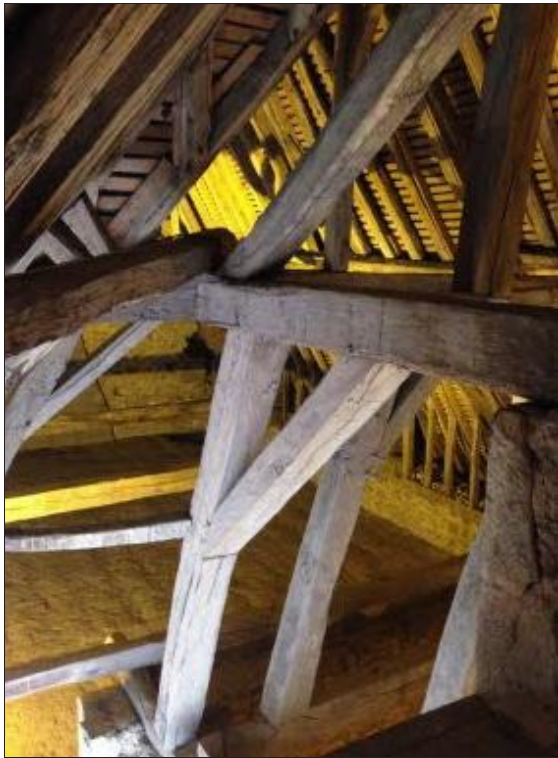
■ Les charpentes du château de Drée.

Une visite des charpentes du château de Drée, « En intimidée », est prévue le 1 er mai à 9 heures, pour 15 € par personne, avec réservation est obligatoire. Lors de cette journée, les participants pourront découvrir les deux tiers du château en privé, avec au maximum dix personnes.